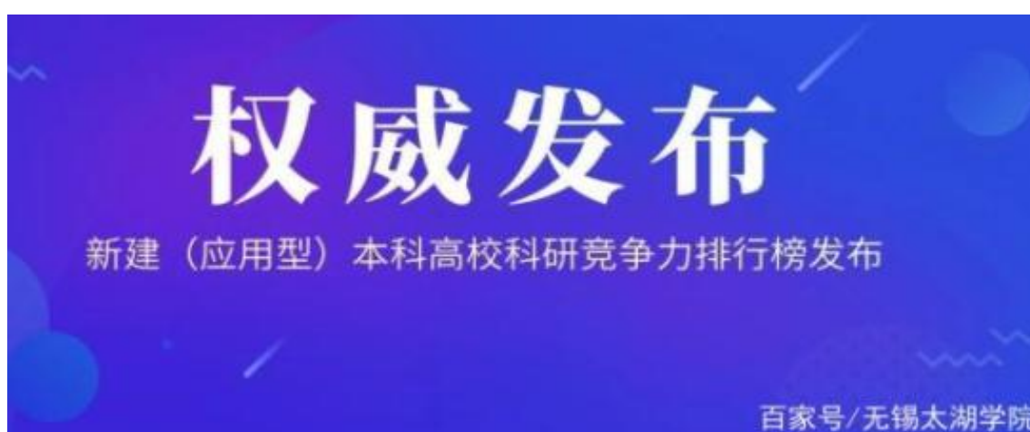
我国新建（应用型）本科高校科研竞争力排行榜

中国江苏网讯 无锡太湖学院和苏州大学教育学院等有关学者成立的“中国新建（应用型）本科高校综合竞争力排行课题组”（ICAUR），近日正式发布“中国新建（应用型）本科高校科研竞争力排行榜”，从论文、课题、奖励、发明专利等四个维度对新建本科高校科研情况进行评价，东莞理工学院、南京工程学院、临沂大学位居科研排行榜前三甲，进入 100 强的高校中有 95 所是公办应用型本科高校。